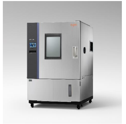
· 사이즈(WXHXDcm) : 110 X 100 X 100